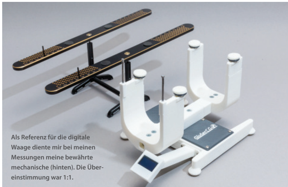
Als Referenz für die digitale Waage diente mir bei meinen Messungen meine bewährte mechanische (hinten). Die Übereinstimmung war 1:1.

Die Bedienungsanleitung ist zwar nur in spanischer und englischer Sprache gehalten, aber eigentlich bräuchte man sie gar nicht: Waage unbelastet (!) einschalten und kurz warten, bis sie Betriebsbereitschaft signalisiert. Dann den Segler auflegen, Nasenleisten bis an die Anschläge schieben und das Maß des Schwerpunkts auf dem Display ablesen. Gleichzeitig bekommt man auch das Gesamtgewicht des Modells angezeigt.