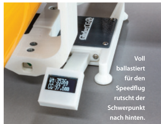
Voll ballastiert für den Speedflug rutscht der Schwerpunkt nach hinten.

Akku ausprobieren. Ich will ja nicht hoffen, dass man am Modell einen Schaden reparieren muss. Aber in all den Fällen ist es sehr hilfreich, wenn man nach den Umbaumaßnahmen auf einen sehr exakt reproduzierbaren Wert zurückgreifen kann und nicht neu erfliegen muss.