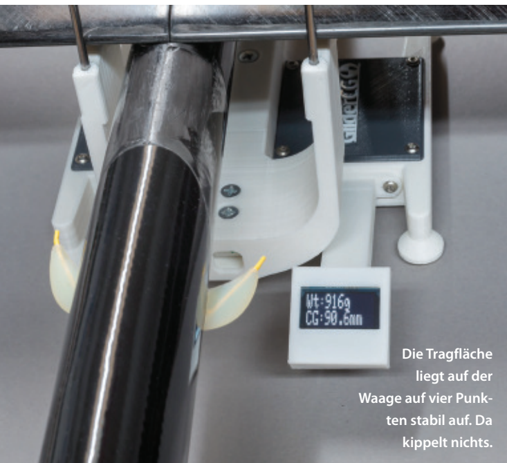
Die Tragfläche liegt auf der Waage auf vier Punkten stabil auf. Da kippt nichts.