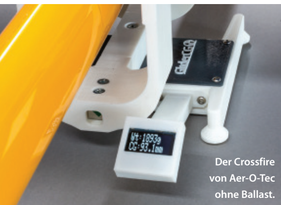
Der Crossfire von Aer-O-Tec ohne Ballast.