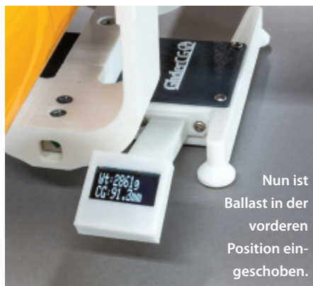
Nun ist Ballast in der vorderen Position eingeschoben.